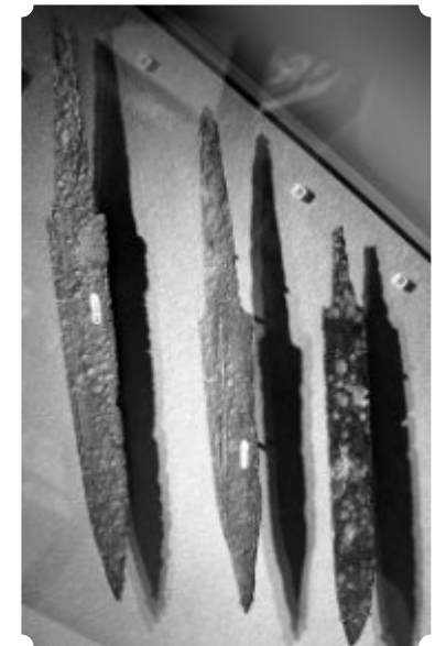
Saxe. Mit einer Waffe dieser Art wird Sigibert getötet.

Zur Zeit dieses Mordes hält sich Brunichild gerade mit ihren Kindern in Paris auf. Ein Vertrauter Brunichilds und Gegner Chilperichs rettet Sigiberts und Brunichilds gerade fünfjährigen Sohn Childebert II. aus Paris und bringt ihn in Sicherheit. Brunichild