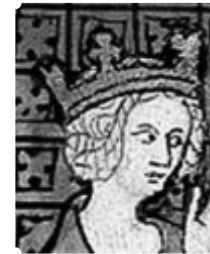
Natürlich nur stilisiert und nicht naturgetreu: Fredegunde

Aktuell bringt es Fredegunde übrigens wenig, mögliche Erben aus dem Weg zu räumen. Denn ihre drei eigenen Söhne sind bereits als Kinder gestorben. Aber dieser Mangel an männlichen Erben lässt sich ja mit etwas Glück wieder beheben. Und tatsächlich bringt sie zwei Jahre später einen vierten Sohn zur Welt. Zwar stirbt auch er 584 im Alter von zwei Jahren. Doch im selben Jahr wird schließlich ein fünfter Sohn geboren. Dieses Kind, Chlothar II., wird das Erwachsenenalter erreichen.