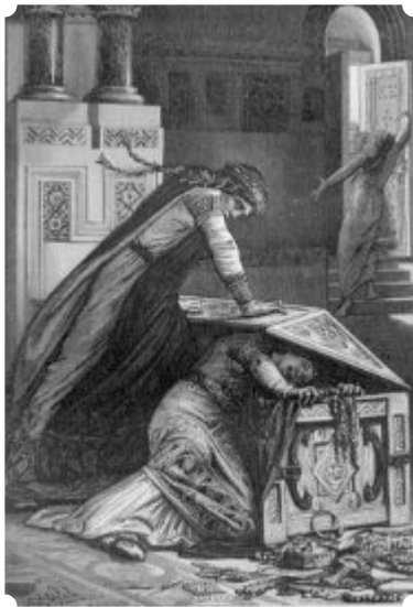
Der Höhepunkt des Mutter-Tochter-Konflikts, historisierender Stahlstich aus dem Jahr 1887

immer berücksichtigen, dass uns das meiste aus den Aufzeichnungen Gregors von Tours überliefert ist. Zwar dürfte der Großteil seiner Schilderungen der Wahrheit entsprechen. Es ist aber unübersehbar, dass Gregor die ehemals unfreie Magd Fredegunde in diesem Spiel um Macht und Einfluss zur Antagonistin der von ihm viel höher geschätzten Königstochter Brunichild macht.