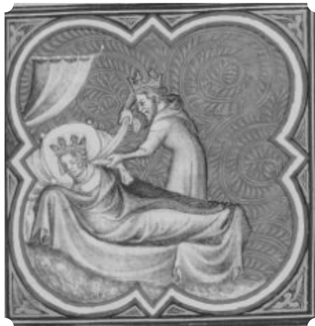
Galswintha wird erdrosselt. Miniatur aus dem 14. Jahrhundert

Aber auf die Dauer garantiert auch Reichtum keine Treue. Chilperich wendet sich wieder seiner einstigen Geliebten Fredegunde zu, einer Magd aus dem Hofstaat seiner ersten Frau Audovera, die ihrerseits in ein Kloster verbannt wird. Die gedemütigte Galswintha bittet ihn, sie zu ihrem Vater zurückgehen zu lassen, die Schätze könne er behalten. Davon will Chilperich aber nichts wissen. Ungefähr drei Jahre nach der Hochzeit, im Jahr 570, findet Chil-